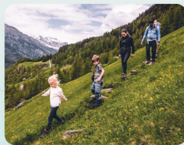
Sentieri per la famiglia