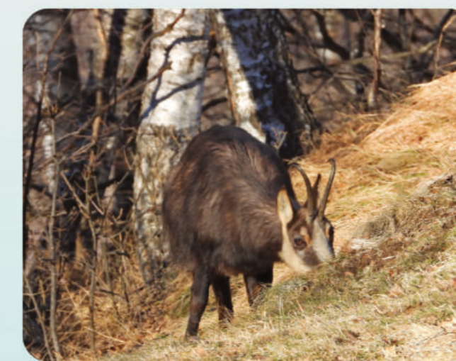
Camoscio al pascolo