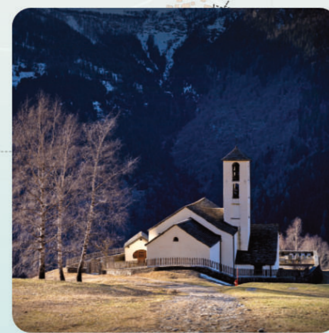
Chiesa S. Bartolomeo