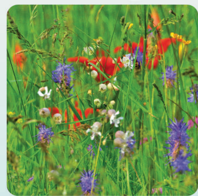
Fiori di primavera

2 Cappella dell'Addolorata / Addolorata Kapelle Costruita nel 1822, sorge a ridosso della casa parrocchiale e a fianco di un'antica osteria, dove gli uomini erano soliti ritrovarsi dopo la messa. / Im Jahr 1822 errichtet, steht die Kapelle unmittelbar am Pfarrhaus und neben einem alten Wirtshaus, wo sich die Männer nach dem Gottesdienst aufhielten.